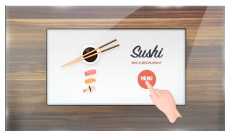
Dotkněte se skla

ProLite ProLite TF1615MC-B1 (39.5 cm) používá PCAP dotykovou technologii a je zabudován do okuláru s bez rámečkovým šasi. Díky skleněné vrstvě kryjící obrazovku a robustnímu rámu zaručuje vysokou odolnost a odolnost proti poškrábání, takže je ideální pro kiosky a místa veřejného prostoru. Vybavená pěnovým těsněním, podporuje bezproblémovou montáž do kiosků a zajišťuje stupeň krytí IP65, což vede k odolnosti proti prachu a vodě v přední části obrazovky. Orientace na šířku, na výšku i lícovou stranou zajišťuje flexibilní možnosti montáže téměř v jakékoli instalaci. Pro snadnou montáž a umístění je přístroj ProLite TF1615MC-B1 vybaven externími montážními držáky ( OMK5-1 ), což je ideální řešení pro integrátory kiosku, průmyslové prostředí, řídicí místnosti a interaktivní multimédia.