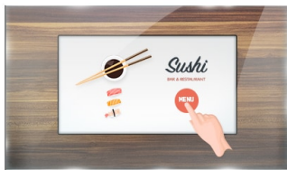
Тач через стекло

The ProLite TF1615MC-B1 (15.6 inch) uses PCAP touch technology and is built into an eye-catching bezel with edge-to-edge glass. Thanks to a glass overlay covering the screen and a rugged bezel, it guarantees high durability and scratch-resistance, making it perfect for kiosk and high use public facing applications. Equipped with a foam seal finish it supports seamless integration into kiosks and provides IP65 rating resulting in dust and water resistance from the front. Landscape, portrait and face-up orientation ensures flexible mounting possibilities in almost any installation. For ease of integration, the ProLite TF1615MC-B1 can be equipped with optional external mounting brackets ( OMK5-1 ) making it an ideal solution for kiosk integrators, industrial environments, control rooms and interactive multimedia.