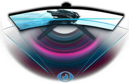
Изогнутый дизайн 1500R

Изогнутая VA-панель 1500R с частотой обновления 165Гц, временем отклика 0,2мс (MPRT) и разрешением 2560x1440 обеспечивает захватывающие впечатления от просмотра и гарантирует превосходное качество изображения. Регулируемая по высоте подставка позволяет легко регулировать положение экрана. Возможность настраивать параметры экрана с использованием предустановленных и настраиваемых игровых режимов вместе с функцией Black Tuner дает Вам полный контроль над темными сценами и гарантирует, что детали всегда будут четко видны.