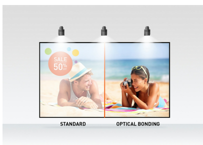
Optical bonded PCAP

Le moniteur Open Frame Full HD (1920x1080) ProLite TF2238MSC-B1 avec technologie IPS offre des couleurs exceptionnelles et de larges angles de vue. La technologie tactile capacitive projective (PCAP) à 10 points avec liaison optique garantit une réponse tactile fluide et précise et une réflexion lumineuse réduite. De plus, l'écran est protégé contre l'humidité et le développement éventuel de l'humidité. Un boîtier en métal robuste et un verre bord à bord résistant aux rayures 7H avec revêtement anti-empreintes digitales rendent le moniteur particulièrement adapté à une intégration dans des environnements exigeants. Le moniteur est également conforme à la norme de protection IPX1, le rendant étanche à l'eau pendant un certain laps de temps contre les éclaboussures. Le ProLite TF2238MSC-B1 peut être utilisé en orientation paysage, portrait et face vers le haut. Une solution parfaite pour les systèmes de kiosque, la vente au détail et les installations interactives de signalisation numérique.