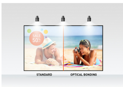
Optical bonded PCAP

El monitor de marco abierto Full HD (1920x1080) ProLite TF2238MSC-B1 con tecnología de panel IPS ofrece colores excepcionales y amplios ángulos de visión. La tecnología táctil capacitiva proyectada (PCAP) de 10 puntos con enlace óptico garantiza una respuesta táctil fluida y precisa, y una menor reflexión de la luz; además, la pantalla está protegida contra la humedad y el desarrollo potencial de humedad. Una resistente carcasa de metal y un cristal resistente a los arañazos de borde a borde de 7H con revestimiento antihuellas hacen que el monitor sea especialmente adecuado para la integración en entornos exigentes. El monitor también cumple con la clasificación de protección IPX1, lo que lo hace resistente al agua durante un período de tiempo contra salpicaduras. El ProLite TF2238MSC-B1 se puede usar en orientación horizontal, vertical y hacia arriba. Una solución perfecta para sistemas de quioscos, venta al por menor e instalaciones de señalización digital interactiva.