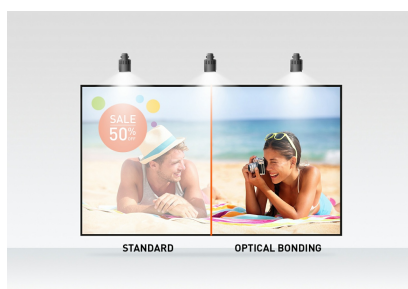
PCAP sa optičkim vezama

Full HD (1920x1080) Open Frame monitor ProLite TF2238MSC-B1 sa IPS tehnologijom panela nudi izuzetne boje i široke uglove gledanja. Optical Bonded Projective Capacitive (PCAP) tehnologija dodira sa 10 tačaka obezbeđuje besprekoran i precizan odgovor na dodir i nižu refleksiju svetlosti, pored toga, ekran je zaštićen od vlage i potencijalnog razvoja vlage. Robusno metalno kućište i 7H staklo od ivice do ivice otporno na ogrebotine sa premazom protiv otisaka prstiju čine monitor posebno pogodnim za integraciju u zahtevnim okruženjima. Monitor takođe ispunjava IPX1 stepen zaštite, što ga čini voodootpornim tokom određenog vremenskog perioda od kapanja vode. ProLite TF2238MSC-B1 se može koristiti u vodoravnom, portretnom i okrenutom nagore. Savršeno rešenje za sisteme reklamnih panela, maloprodajne i interaktivne digitalne reklamne instalacije.