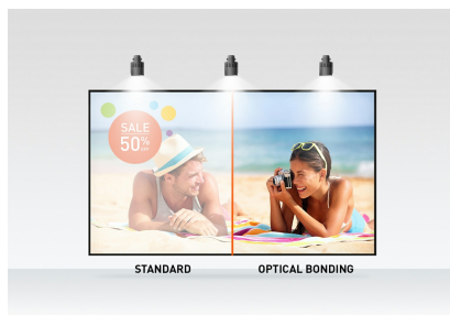
Optical bonded PCAP

Le ProLite T2755MSC avec la résolution Full HD (1920x1080) et la dalle IPS offre des couleurs exceptionnelles et de larges angles de vision. La technologie tactile PCAP (Optical Bonded Projective Capacitive) à 10 points garantit une réponse tactile transparente et précise, ainsi qu'une réflexion lumineuse réduite. Un revêtement nanométrique spécial assure un toucher plus doux et moins de résistance lors du balayage. Il rend l'écran moins statique et moins sensible à la saleté, à la poussière et aux empreintes digitales. Un choix parfait pour un large éventail d'applications.