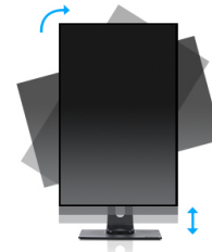
HAS + Pivot

La technologie VA offre un contraste plus élevé, des noirs plus sombres et les angles de vision bien meilleurs que la technologie traditionnelle TN. L'image aura l'air bien quel que soit l'angle sous lequel vous la regardez.