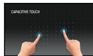
Touch Technologie - Kapazitiv

Die IPS-Displays sind vor allem für weite Betrachtungswinkel und natürliche, hochgenaue Farben bekannt. Sie eignen sich besonders für farbkritische Anwendungen.