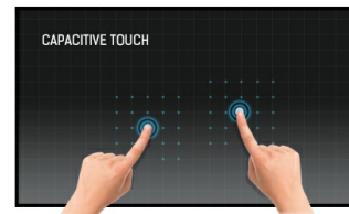
Touch technology - capacitive projetée

Les écrans IPS sont surtout connus pour leurs larges angles de vision et leurs couleurs naturelles très précises. Ils sont particulièrement adaptés aux applications à couleur critique.