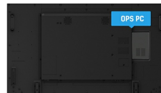
OPS PC SLOT

I display IPS sono noti soprattutto per gli ampi angoli di visione e i colori naturali e precisi. Sono particolarmente adatti per applicazioni critiche dal punto di vista del colore.