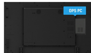
OPS PC SLOT

I display IPS sono noti soprattutto per gli ampi angoli di visione e i colori naturali e precisi. Sono particolarmente adatti per applicazioni critiche dal punto di vista del colore.