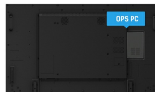
OPS PC SLOT

Les écrans IPS sont surtout connus pour leurs larges angles de vision et leurs couleurs naturelles très précises. Ils sont particulièrement adaptés aux applications à couleur critique.