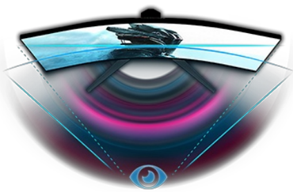
KRYTÝ NÁVRH 1500R

Schopnost přizpůsobit nastavení obrazovky pomocí předdefinovaných a vlastních herních režimů spolu s funkcí Black Tuner vám poskytne celkovou kontrolu nad tmavými scénami a zajišťuje, aby byly detaily vždy jasně viditelné. Díky výškově nastavitelnému stojanu můžete snadno nastavit polohu obrazovky podle svých preferencí, abyste zajistili pohodlí během maratonských her.