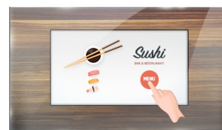
Dotyk przez szkło

Matryce IPS są doceniane ze względu na szerokie kąty widzenia i dokładne, naturalne odwzorowanie kolorów. Sprawdzają się szczególnie tam, gdzie najważniejszą rolę odgrywają kolory.