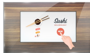
Tocco attraverso vetro

I display IPS sono noti soprattutto per gli ampi angoli di visione e i colori naturali e precisi. Sono particolarmente adatti per applicazioni critiche dal punto di vista del colore.