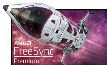
Technologie FreeSync™ Premium

La Résolution UHD (3840 x 2160), plus connu sous la dénomination 4K, vous offre une zone d'affichage gigantesque avec 4 fois plus d'espace d'information et de travail qu'un écran classique en Full HD. En raison de sa haute densité de points par pouce (DPI), il affichera des images incroyablement fines et pointues.