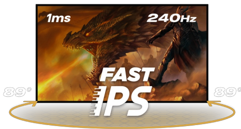
240Hz & 1ms MPRT

La dalle en technologie Fast IPS garantit une superbe qualité d'image, et la possibilité de régler la luminosité et les nuances sombres avec la fonction Black Tuner offre de meilleures performances de visualisation dans les zones ombragées. Pour assurer le confort pendant les sessions de jeu marathon, vous pouvez facilement ajuster la position de l'écran selon vos préférences grâce au support réglable en hauteur.