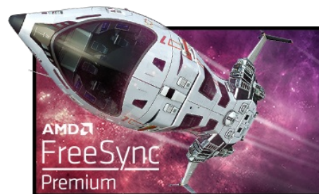
Technologie FreeSync™ Premium

La dalle en technologie Fast IPS à 240 Hz garantit des scènes de champ de bataille vives, haute fidélité d'affichage avec des couleurs exceptionnellement précises et offre un temps de réponse d'image animée (MPRT) époustoufflant de 1 ms.