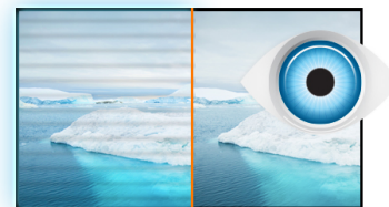
Flicker free + Blue light

La tecnologia dei pannelli VA offre un contrasto elevato e una buona brillantezza dei colori con un angolo di visione molto più ampio rispetto alla tecnologia dei pannelli TN standard.